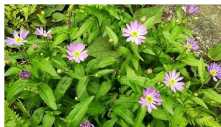
入り口土手の都忘れ