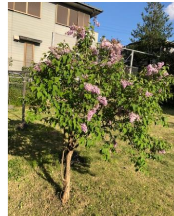
寮の中庭に咲くライラック

しかし、私には常に神様がついておられ、将来についても神様が計画して下さっていることを信じ、従い、神様から離れずに生活していきます。これから先が見えない人生を歩み始めますが、登戸学寮との出会いに感謝し、聖く生活していきたいと思っています。